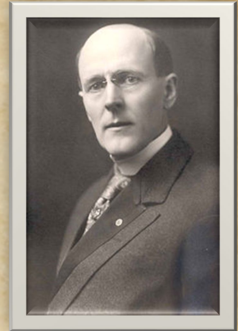
Paul Percy Harris 19. April 1868 – 27. Januar 1947

Rotary startet med én manns visjoner - Paul Harris. Advokaten i Chicago dannet Chicago Rotary Club 23. februar 1905, slik at personer i ledende stillinger og med ulik bakgrunn kunne utveksle ideer og danne meningsfulle, livslange vennskap.