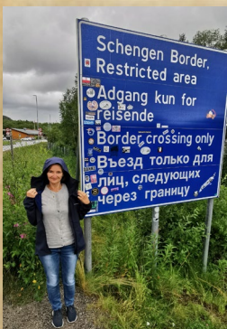
En kikk over grensa ved Storskog Grensestasjon

Jeg hørte det, - fra tidligere guvernører - «når du kommer til klubbene blir du mottatt som en konge» Det kan jeg underskrive på – fra dette året vil klubbbesøkene være de beste og kjæreste minne. Alle engasjerte medlemmene, prosjektene og innblikket i alt det fantastiske arbeidet som gjøres for Rotary.