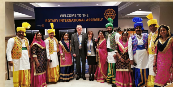
Fra RI Assembly: Festivalkveld – vi var på vei til rommet da vi ble kapret av denne fargerike gjengen fra India

Festivalkveld er en mulighet til å vise fram nasjonale drakter og kostymer. Vi følte oss litt grå og kjedelige vi fra distrikt 2275, men du verden så godt vi ble mottatt av denne gjengen fra India.