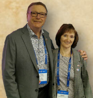
Opplæringen ved RI Assembly er bade for påtroppende guvernør og ledsager

Jeg er enig med en som sa: «Guvernørene burde være guvernør minst to år». Men, da ville mange gått glipp av muligheten. Jeg unner alle å få den opplevelsen det er å være leder for et distrikt. Jeg er ikke ferdig utlært, - det er alltid nye sider ved Rotary og nye sider ved meg selv.