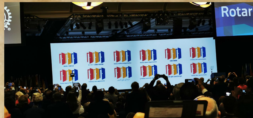
1200 Rotarianere er nettopp blitt presentert for årets logo og tema: "Rotary Opens opportunities"