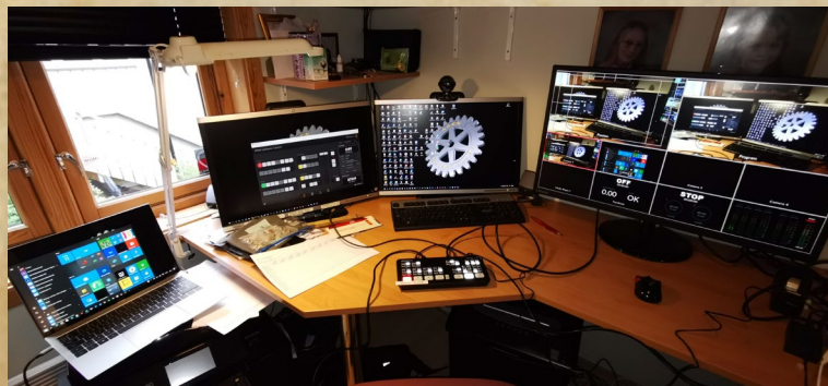
Fra prøvekjøring av teknikken, - I forkant av distriktskonferansen. Konferansen ble streamet på Youtube

Jeg er helt sikker på at den jevne Rotarianer har økt IT-kompetansen mange hakk dette året. I Rotary Norge er det gjennomført mange tusen nettmøter og vi har utforsket flere forskjellige verktøy.