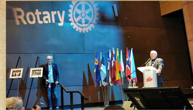
Tidligere president i Polen, Lech Walesa taler til oss Rotarianere.

Talte til oss: Lech Walesa Skipselektriker ved Leninverftet i Gdansk. Ble leder for Solidaritet og senere Polens president i perioden 1990 til 1995.