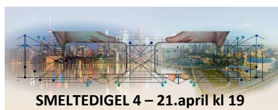
SMELTEDIGEL 4 – 21.april kl 19

De fleste funksjonene blir belyst under PETS . Sørg for at din klubb deltar på PETS – en kilde til faglig påfyll, inspirasjon og motivasjon.